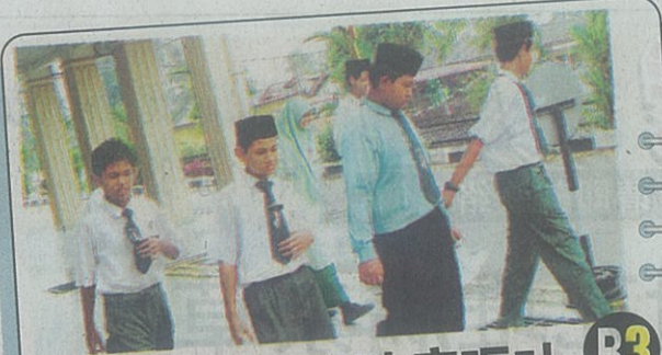
敦玛末国中70人肚痛呕吐 B3